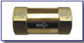
Válvula de Retenção Série 14000