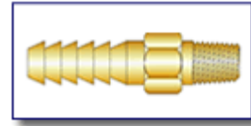
Espigão para Mangueira Série 15000